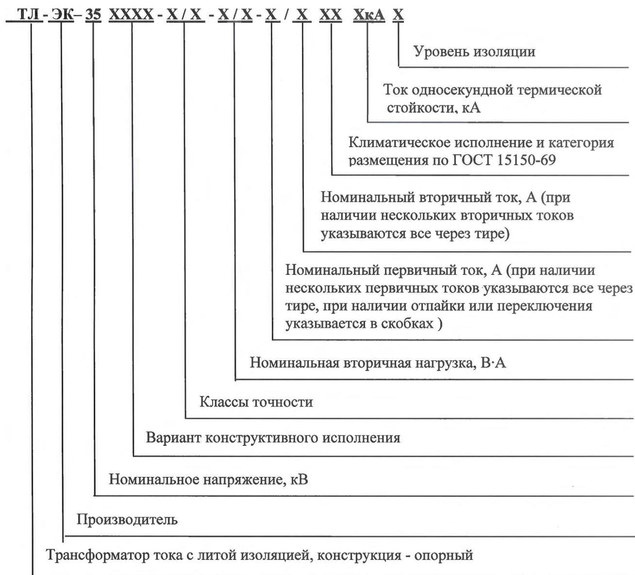
Рисунок 3 – Расшифровка условного обозначения трансформаторов